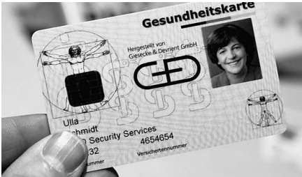
Sorgt für Streit: die elektronische Gesundheitskarte (Muster)

DATENSCHUTZ Die heftig umstrittene „e-Card“ kommt. Den Anfang macht ab heute die Region Nordrhein